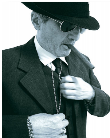
Notre regretté fondateur

«Si je prends mon quart de poulet pour un magret de canard je suis dans l'utopie domestique. [...] Lorsque je conçois un canal latéral au ruisseau des Aygaldes, je suis dans l'utopie affective.» J.B.