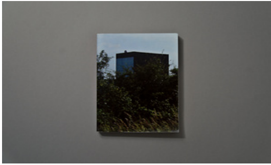
Marko Dapic © Adagp, Paris