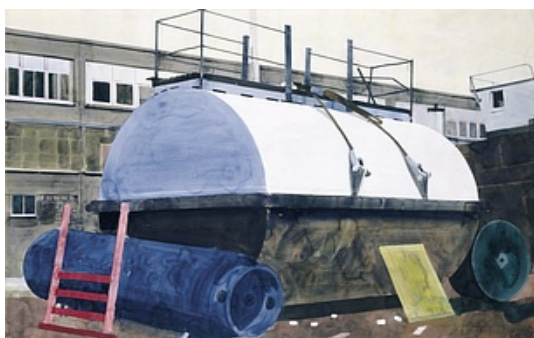
Yves Gallois © Adagp, Paris

Achat à la Galerie Praz-Delavallade en 1995 Inv. : 95.296 95.296