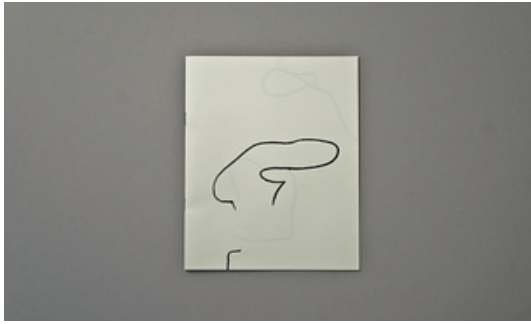
Marko Dapic © Adagp, Paris