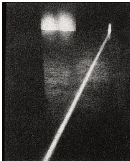
Yves Gallois © Nancy Wilson-Pajic