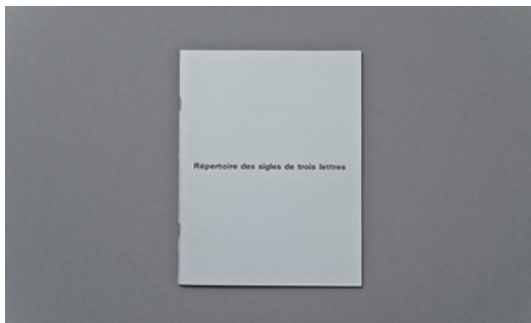
Marko Dapic © Claude Closky