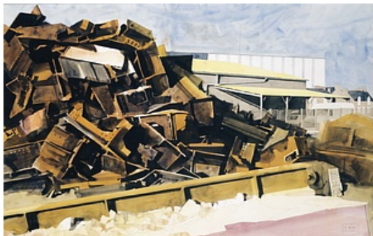
Yves Gallois © Adagp, Paris