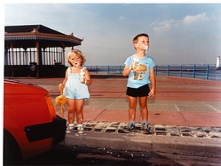
Gérard Bonnet © Martin Parr / Magnum Photos

Achat à l'artiste en 1986 Inv. : 86.109 (A) 86.109 (A)