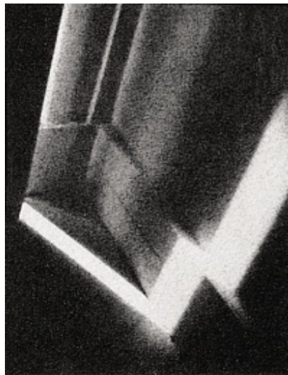
Yves Gallois