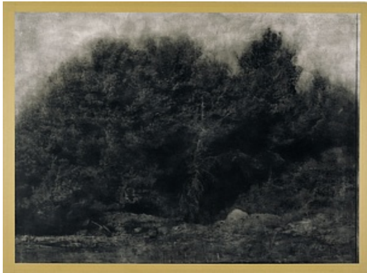
Yves Gallois © Adagp, Paris