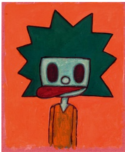
Visuel fourni par l'artiste © Guillaume Pinard