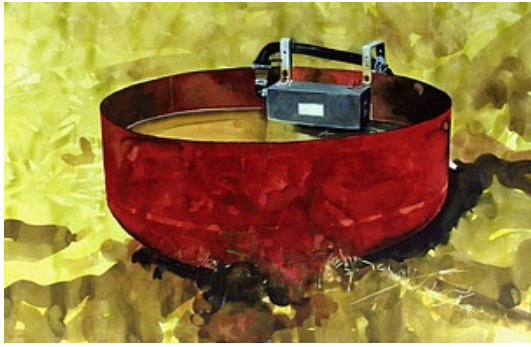
Visuel fourni par l'artiste © Adagp, Paris