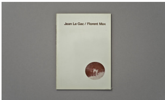
Marko Dapic © Adagp, Paris