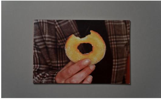
Marko Dapic