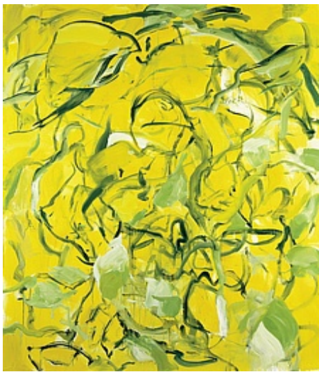
Yves Gallois © Adagp, Paris

Achat à la Galerie Roger Pailhas en 1991 Inv. : 91.197 91.197