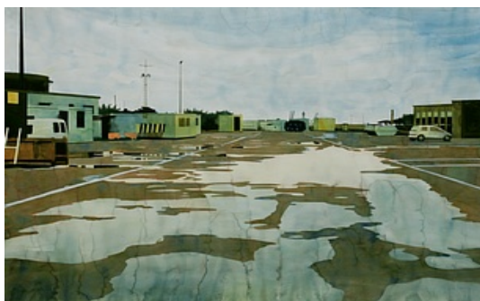
Visuel fourni par l'artiste © Adagp, Paris

Achat à la Galerieofmarseille en 2007 Inv. : 2007.589 2007.589