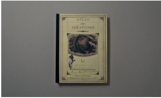
Marko Dapic © Adagp, Paris