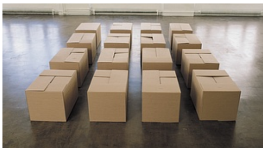
Marc Damage © Claude Closky