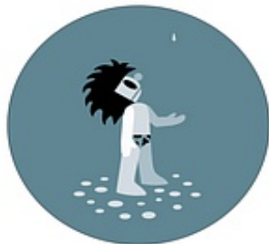
Visuel fourni par l'artiste © Guillaume Pinard

2000 Réalisation sur logiciel Photoshop et tirés sur papier photographique (en labo) 24 x 18 cm 1/5 Les noms qui désignent chaque dessin de la série sont un moyen de les spécifier mais ne doivent pas apparaître lors d'une exposition ou édition. Achat à l'artiste en 2001 Inv. : 2001.479 2001.479