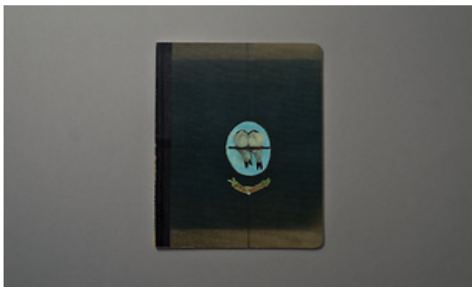
Marko Dapic © Adagp, Paris