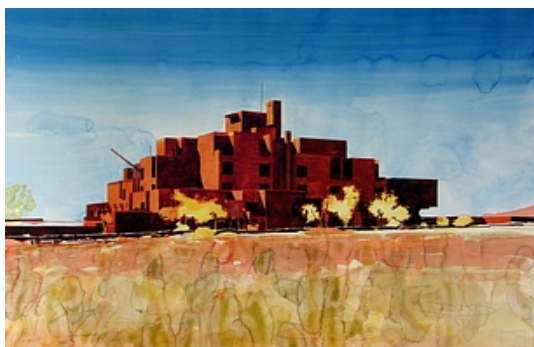
Visuel fourni par l'artiste © Adagp, Paris

Achat à la Galerie Praz-Delavallade en 1995 Inv. : 95.297 95.297