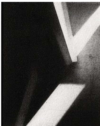
Yves Gallois © Nancy Wilson-Pajic

Achat à la Galerie Michèle Chomette en 1989 Inv. : 88.143 (B) 88.143 (B)