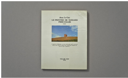
Marko Dapic © Adagp, Paris