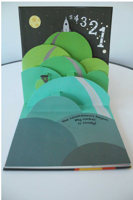
Journey to the moon : A Pop-up Lunar Adventure Andy Mansfield

L' objectif est de traduire comment ces outils fonctionnent et ce qu'ils engendrent , qu'ils y a différents milieux et comment les espèces agissent après le réaménagement.