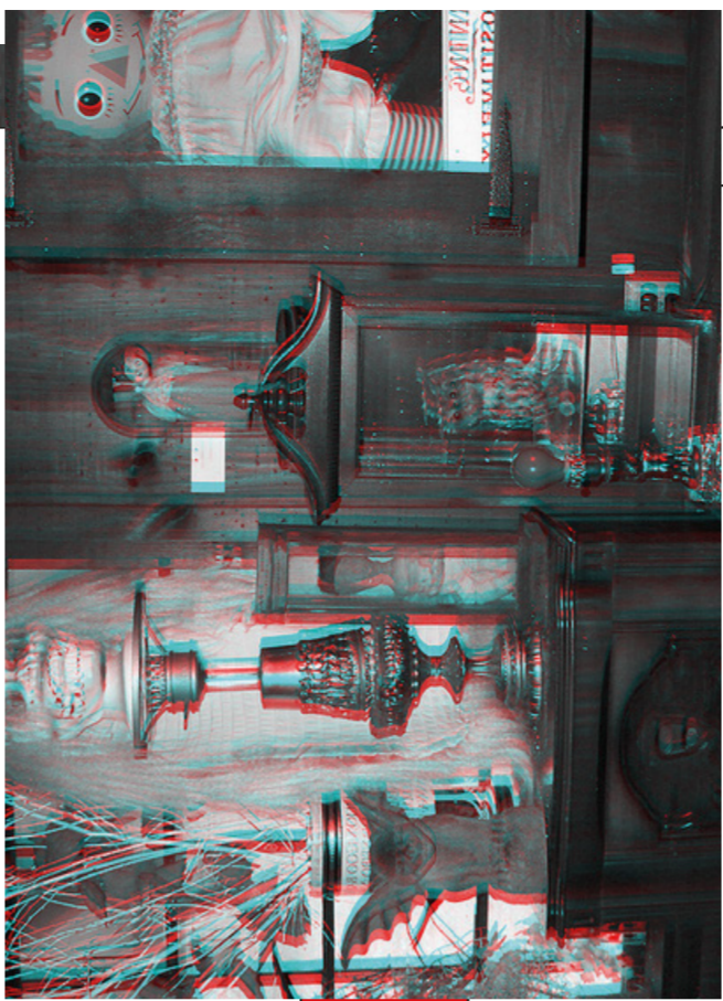
Musée de l'occulte 30 Knollwood Street, à Monroe, dans le Connecticut, P.O.

Suite à de longues années passées ensemble, Ed mourut en 2006, et Lorraine quitta ce monde le 20 avril 2019, entourée de ses proches.