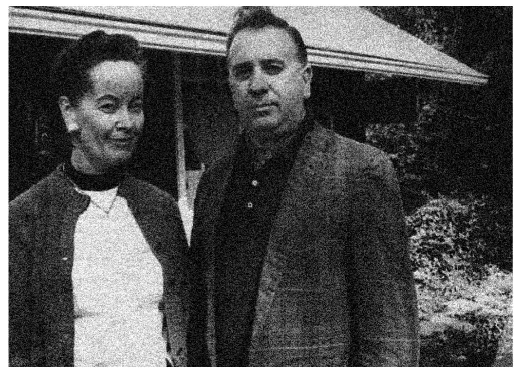
Ed et Lorraine Warren, devant leur maison dans la banlieue d'Enfield

Ed décida alors de raconter à Lorraine son secret. Il lui avoua à la grande surprise de celle-ci qu'il voyait des fantômes. Ce qu'il ignorait, c'est que sa petite amie voulait lui raconter, elle aussi, qu'elle était voyante, et qu'outre à l'une des femmes qui travaillaient à l'école où elle étudiait : 'Les lumières sont plus brillantes que celles de la mère supérieure'. La nonne la regarda perplexe, sans comprendre de quoi la petite parlait. Quelques années plus tard, Lorraine comprit que ces lumières étaient l'aura des gens, et a réalisé de par la réaction de la nonne que ce n'était pas un don commun. C'est d'ailleurs pour cela que, de peur de ne pas être comprise, elle n'a plus raconté à personne ce qui lui arrivait.