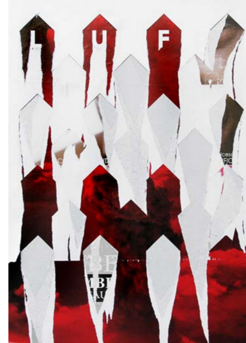
Affiche du Lausanne Underground Film & Music Festival (LUFF) Demian Conrad